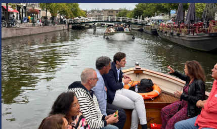
BVL Credifixx Sloepentocht 4 september 2024