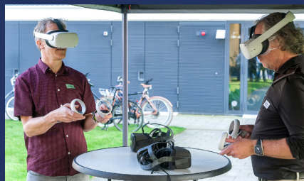
BVL Walk, Talk & Discover 18 september 2024