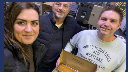
Dag van de Ondernemer 15 november 2024

KLIK HIER OM DE JAARCIJFERS 2024 TE BEKIJKEN >