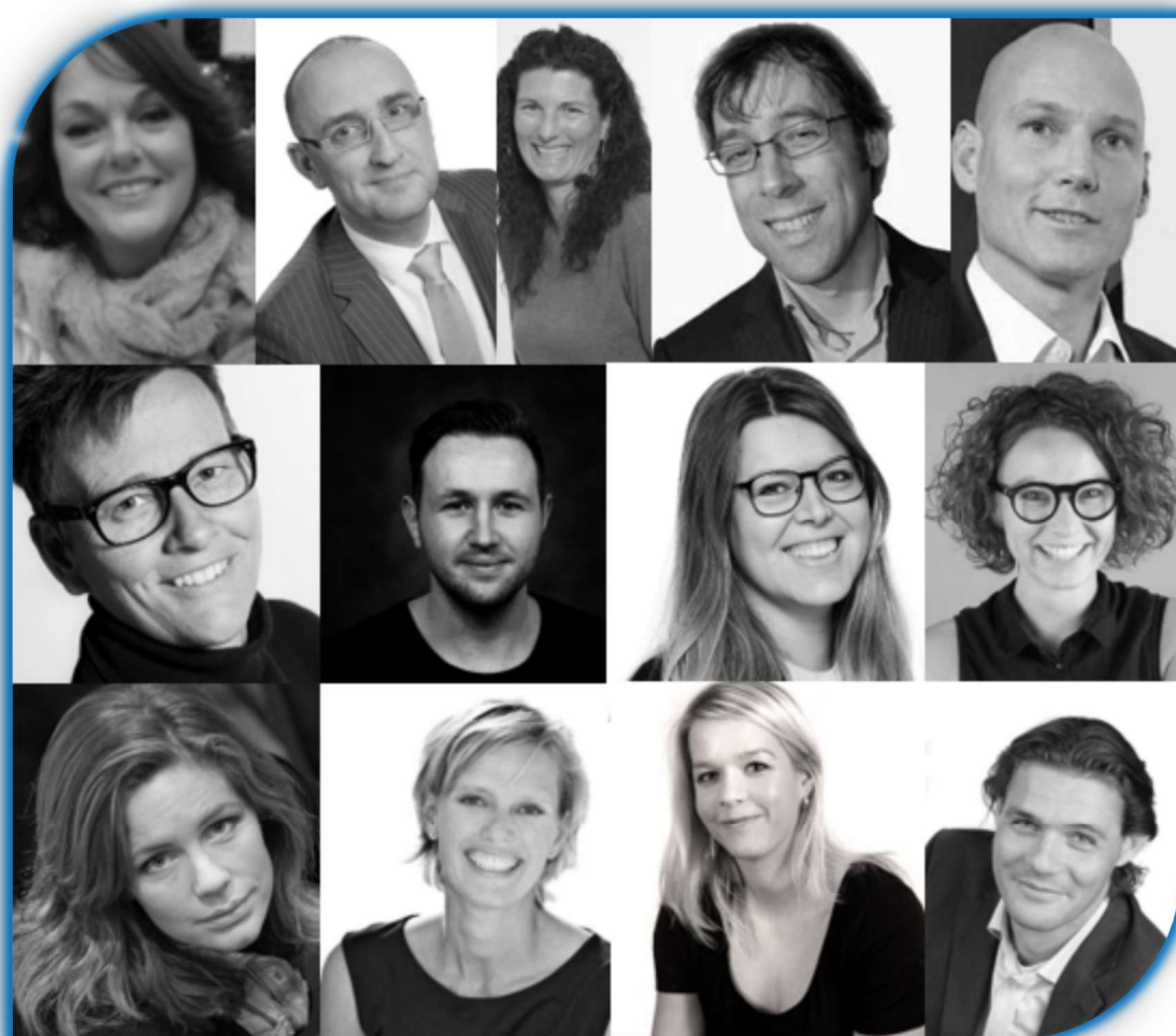
Alle commissieleden van BV Leiden